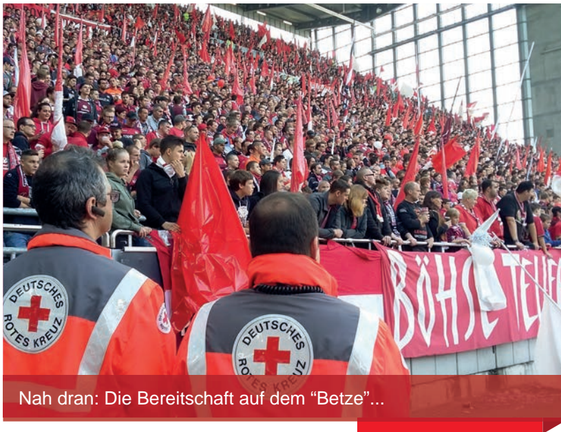
Nah dran: Die Bereitschaft auf dem "Betze"...